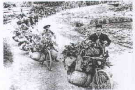
Đoàn dân công hoà tuyến

Trong chiến dịch Điện Biên Phủ, công tác hậu cần đã góp phần to lớn làm nên chiến thắng lẫy lừng, chấn động năm châu, rung động địa cầu của dân tộc ta. Chiến dịch đã huy động tổng lực hàng ngàn phương tiện từ cơ giới đến thô sơ để vận chuyển hàng chục vạn tấn lương thực, đạn dược ra chiến trường. Trong đó đặc biệt phải kể đến con số dân công hoà tuyến lên đến 260 ngàn người (gấp 13 lần so với dự báo của Pháp), đóng góp 11 triệu ngày công. Các con số đó đã nói lên lòng yêu nước, tinh thần quyết chiến, quyết thắng của cả dân tộc trong chiến dịch lịch sử này. Điều đáng tiếc là hiệu quả vận chuyển nói chung là khá thấp, đặc biệt là vận chuyển lương thực bằng dân công gánh bộ, số lượng lương thực tới nơi nộp kho chỉ còn 8%. Nghĩ về con số này Vinh ước ao được góp sức cùng cha ông ngày đó nâng cao hiệu quả vận chuyển, và thế là Vinh thử giải bài toán sau đây: